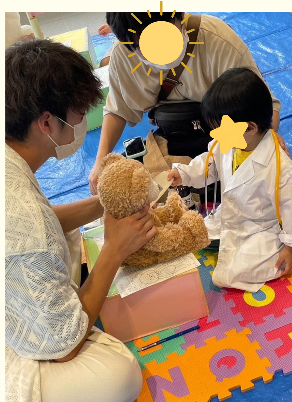
保護者の方にも参加 安全面に配慮