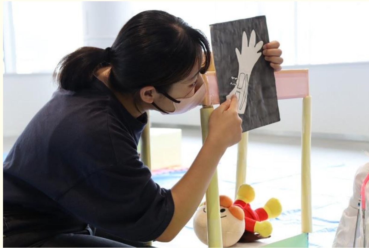
徳島大学さんとの交流 1日で88人の子どもたちが参加