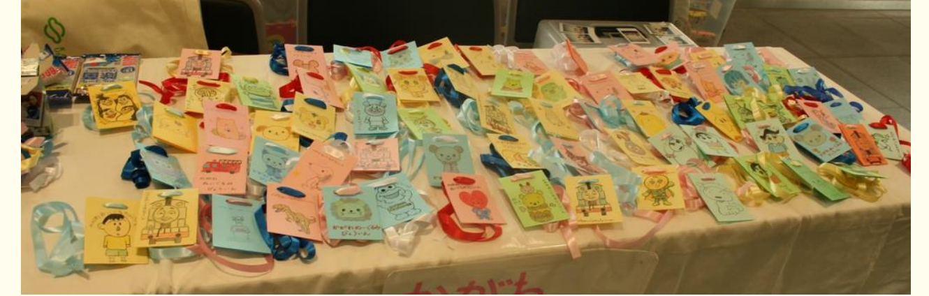
イベントに参加した子どもたちには 記念品にチェキ付きのメダルを配布